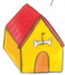
PSÍ BOUDA kennel