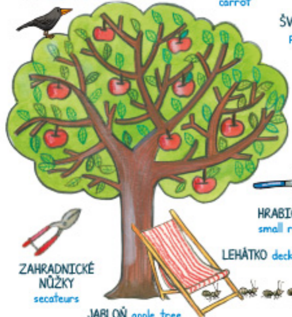
JABLOŇ apple tree