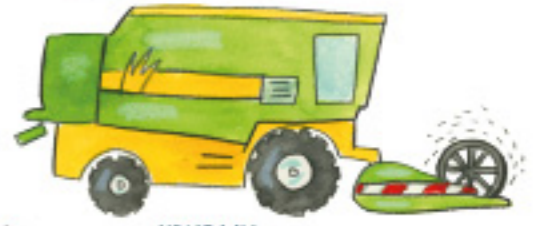
KOMBAJN combine harvester