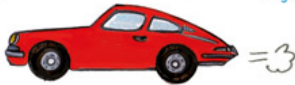
SPORTOVNÍ AUTO sport car