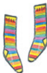
PODKOLENKY knee-high socks