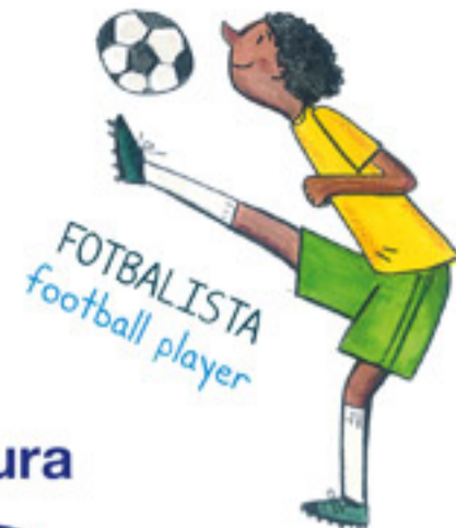
FOTBALISTA football player