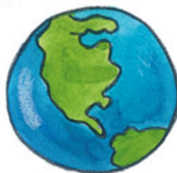
PLANETA ZEMĚ planet Earth