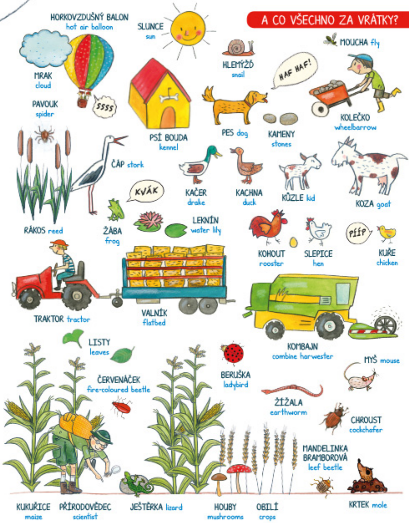
HORKOVZDUŠNÝ BALON hot air balloon